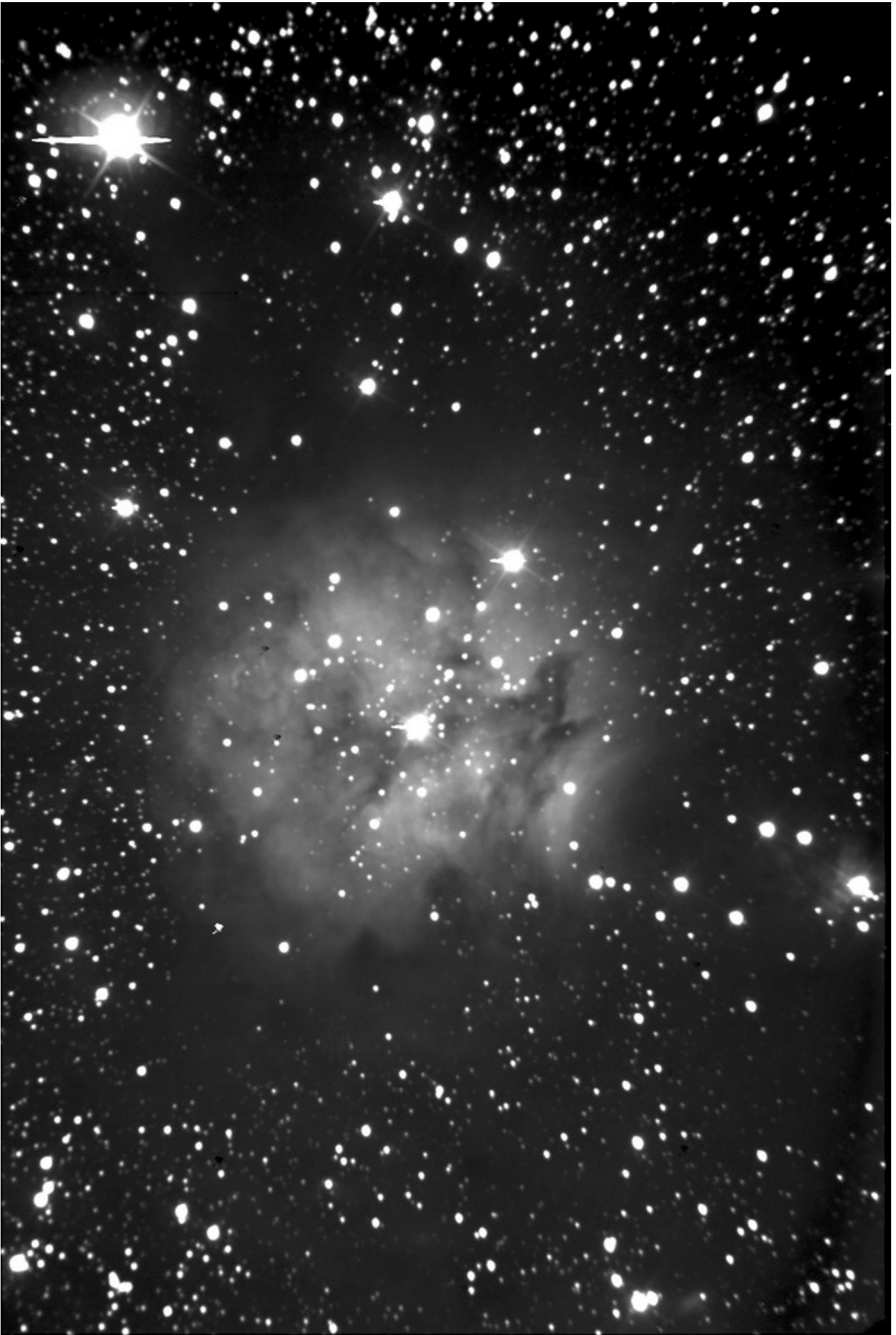
La nébuleuse du Cocon