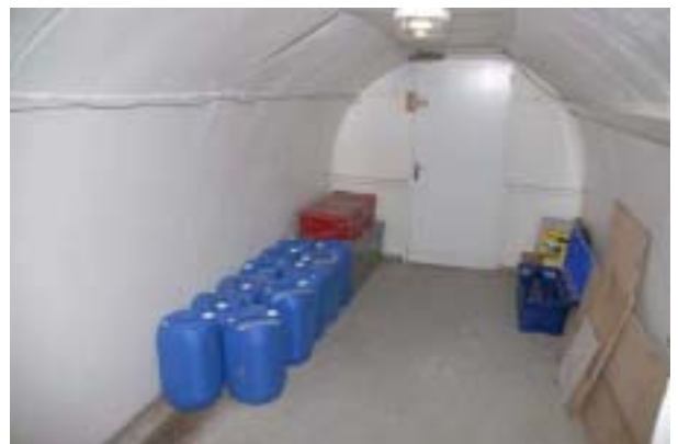
Le rangement de la station