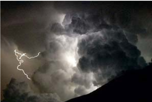
Orage au Pic de Châteaurenard