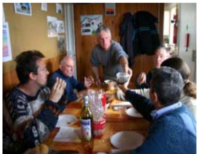
... en ménageant des moments de convivialité