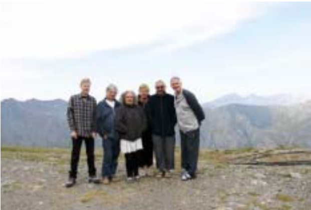
L'équipe de maintenance (deuxième semaine)