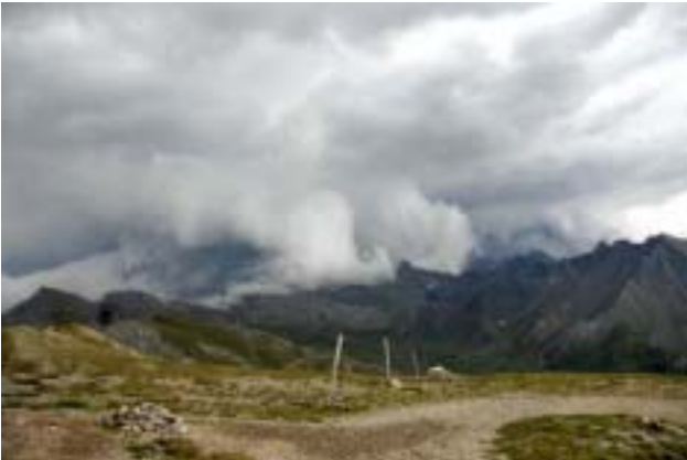
La météo de canicule turbulente