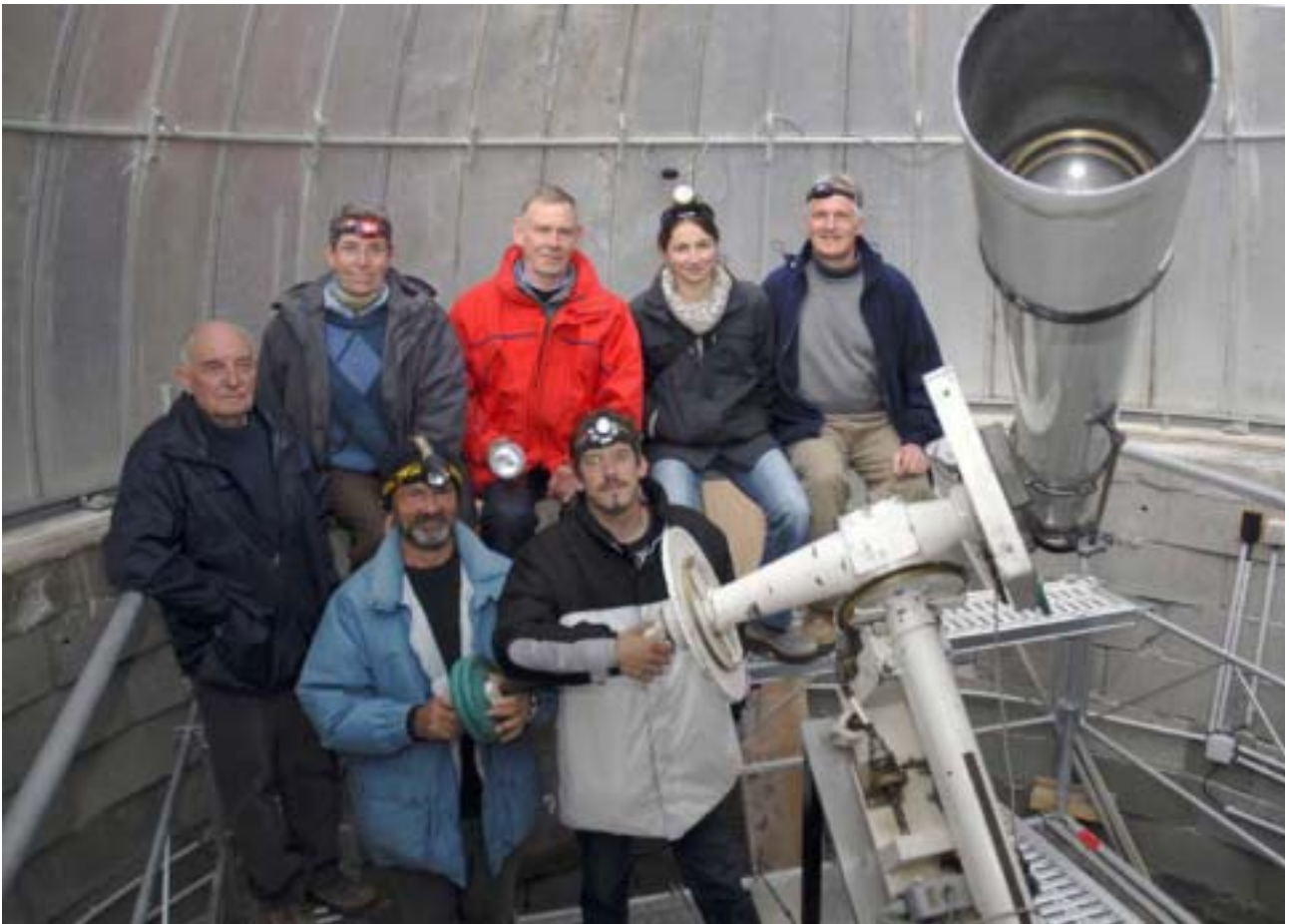
L'équipe SAN dans la deuxième coupole