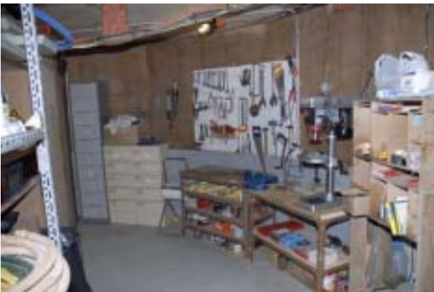
L'aménagement de l'atelier d'entretien