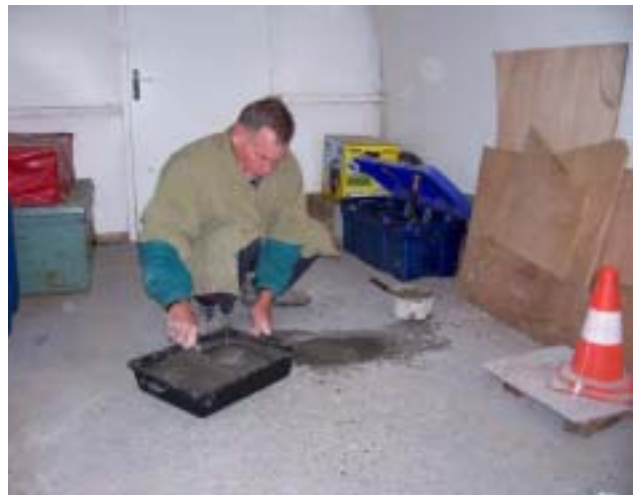
Poursuite des opérations de maintenance