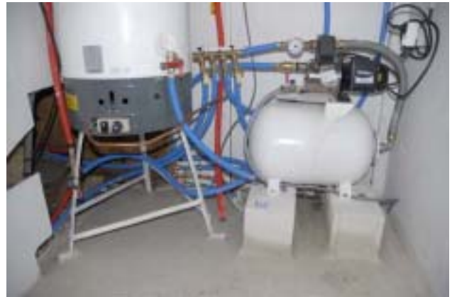
La rénovation du local technique