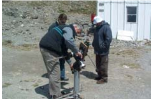
Préparation d'observation solaire avec le PST CORNADO