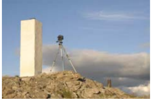
Une toute petite partie de son matériel