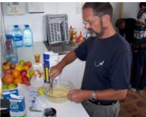
Ne pas se laisser décourager...